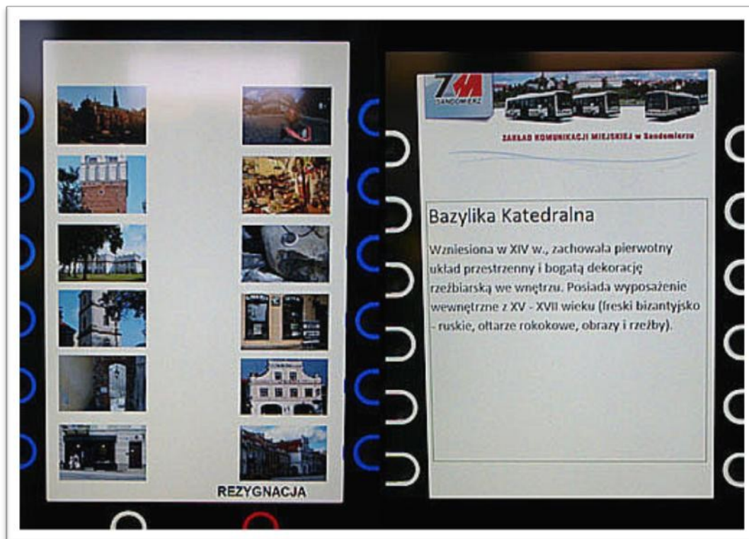
Wybór opcji „Sandomierz” wyświetla zabytki miasta wraz z ich opisami.

Poniżej opcji wyboru biletu znajduje się zakładka o nazwie „Sandomierz”. Po wybraniu tej opcji na ekranie automatu zostanie wyświetlona galeria najpopularniejszych zabytków miasta. Przyciskami dokonujemy wyboru zabytku w celu wyświetlenia krótkiego opisu. Powracamy do menu przyciskiem „REZYGNACJA”.