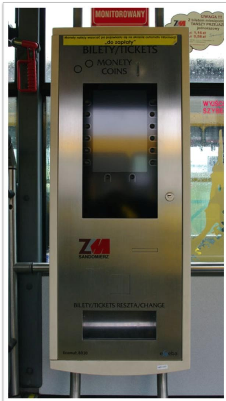
Automat biletowy ticomat.8010

Automat biletowy ticomat.8010 to urządzenie elektroniczne umożliwiające zakup biletu będącego potwierdzeniem uiszczenia opłaty za przejazd środkami komunikacji miejskiej. Automaty biletowe znajdują się w przestrzeni pasażerskiej pojazdu. Każdy pojazd wyposażony jest w ticomat.8010. Urządzenie jest przyjazne i łatwe w obsłudze. Posiada intuicyjne menu.