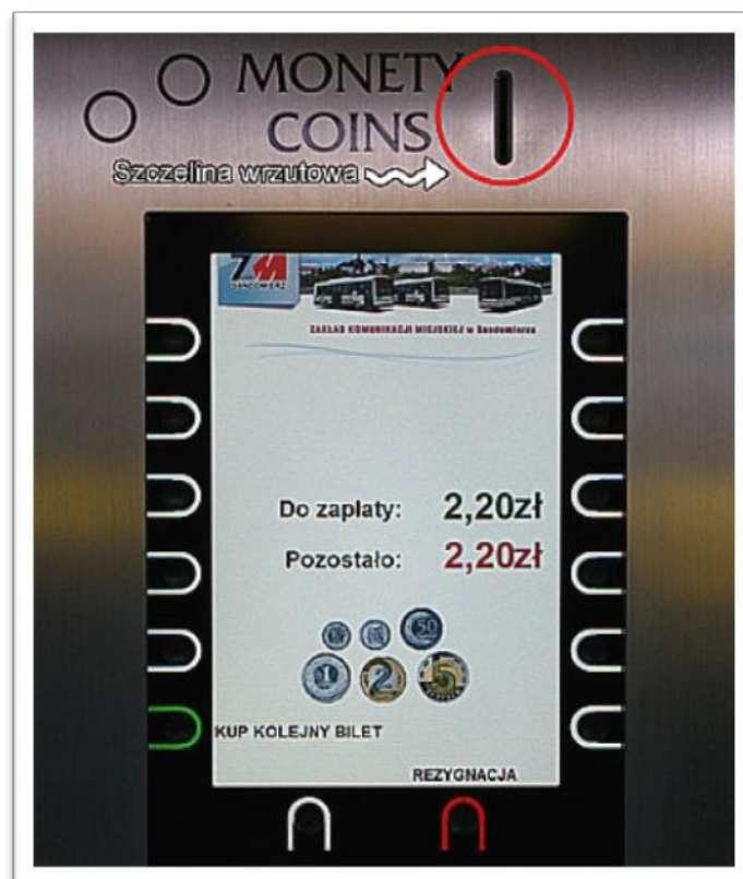
Szczelina wrzutowa automatu

Po wybraniu rodzaju biletu automatycznie otworzy się klapka szczeliny wrzutowej umożliwiająca uzupełnienie kwoty wskazanej na ekranie automatu.