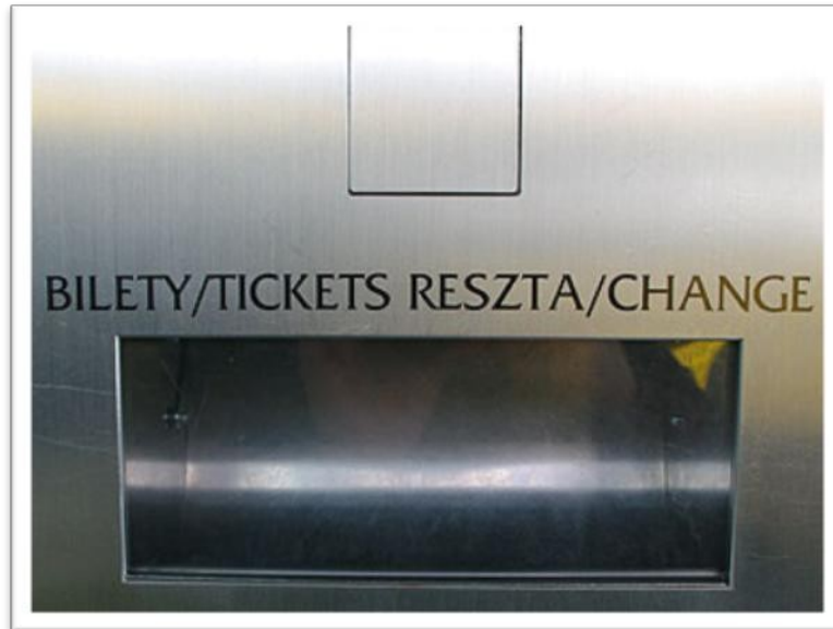
Dolna szalka automatu biletowego

Wydruk następuje automatycznie po uzyskaniu żądanej kwoty. W przypadku, gdy do szczeliny zostanie wrzucona większa wartość monet, aniżeli tak, która jest wymagana, nastąpi wydruk biletu oraz wydanie reszty przez automat. Wydrukowany bilet oraz resztę kwoty można odebrać z dolnej szalki automatu.