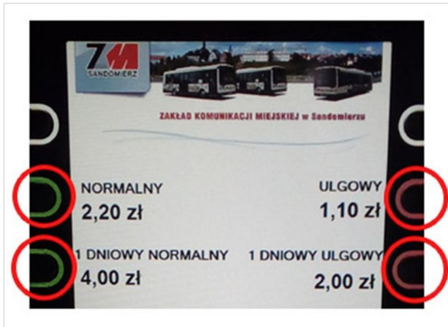
Dokonanie wyboru rodzaju biletu

Po wybraniu rodzaju biletu automatycznie otworzy się klapka szczeliny wrzutowej umożliwiająca uzupełnienie kwoty wskazanej na ekranie automatu.